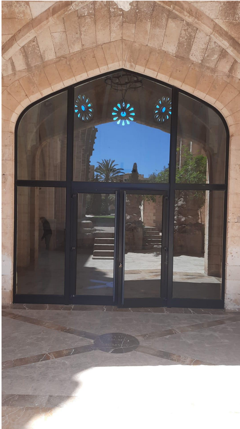
Imatge 6. Entrada capella fonda.

CAPELLA FONDA (consta de quatre capelles laterals de les mateixes dimensions, i un altar)