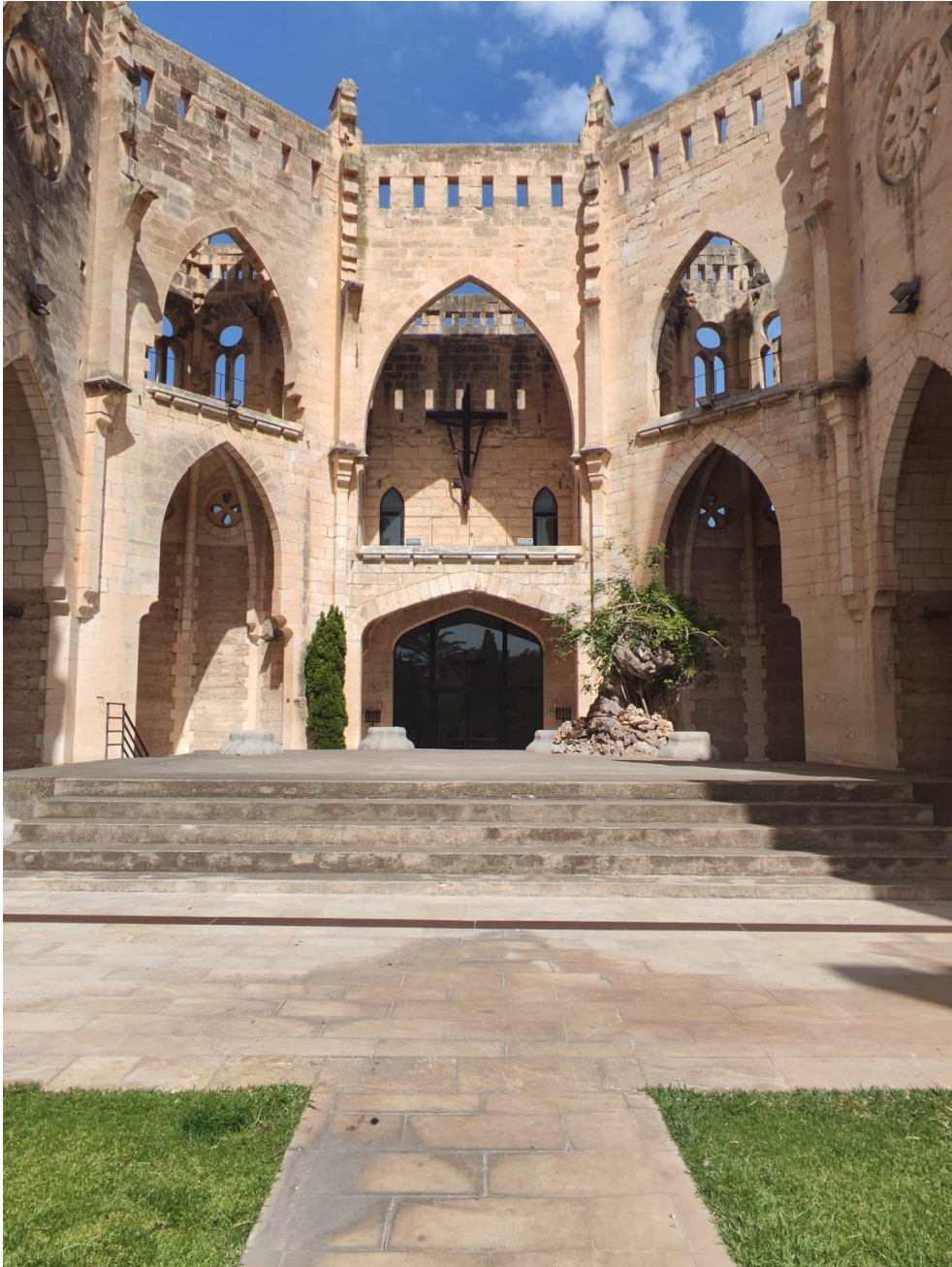
Imatge 12. Vista de l'escenari de l'Església Nova.

L'espai disponible per a la performance és l'escenari situat a l'extrem de l'Església Nova, i l'espai central, tenint sempre en compte que serà un espai de trànsit per al públic assistent.