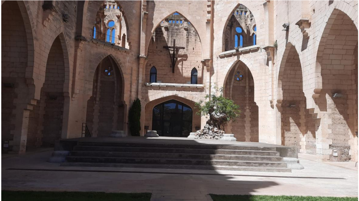
Imatge 3. Visió general de les capelles de l'absis.