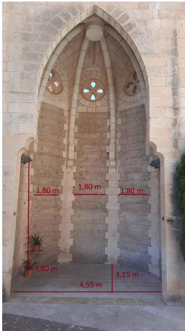
Imatge 5. Mesures capelles grans de l'absis.