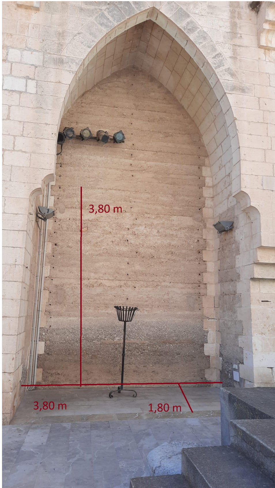
Image 4. Mesures de les capelles laterals petites.