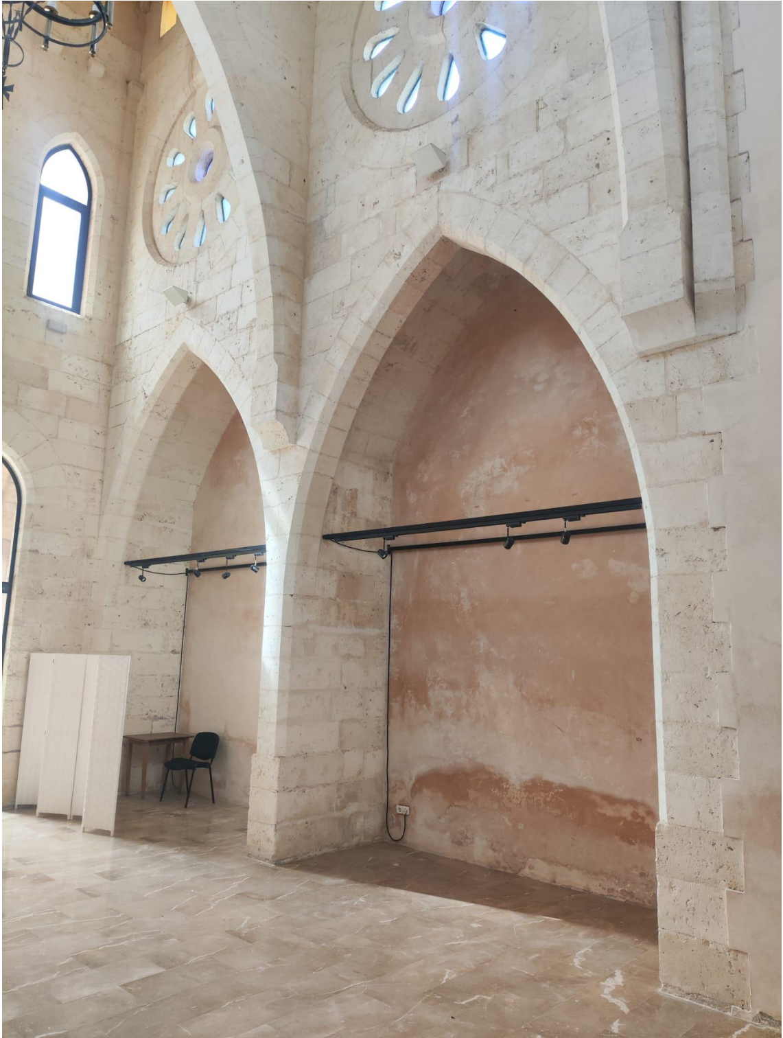
Imatge 11. Capelles laterals de la capella fonda.