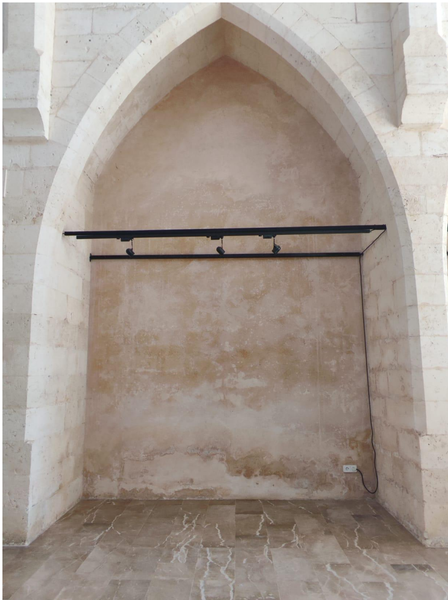
Imatge 10. Capella lateral de la capella fonda