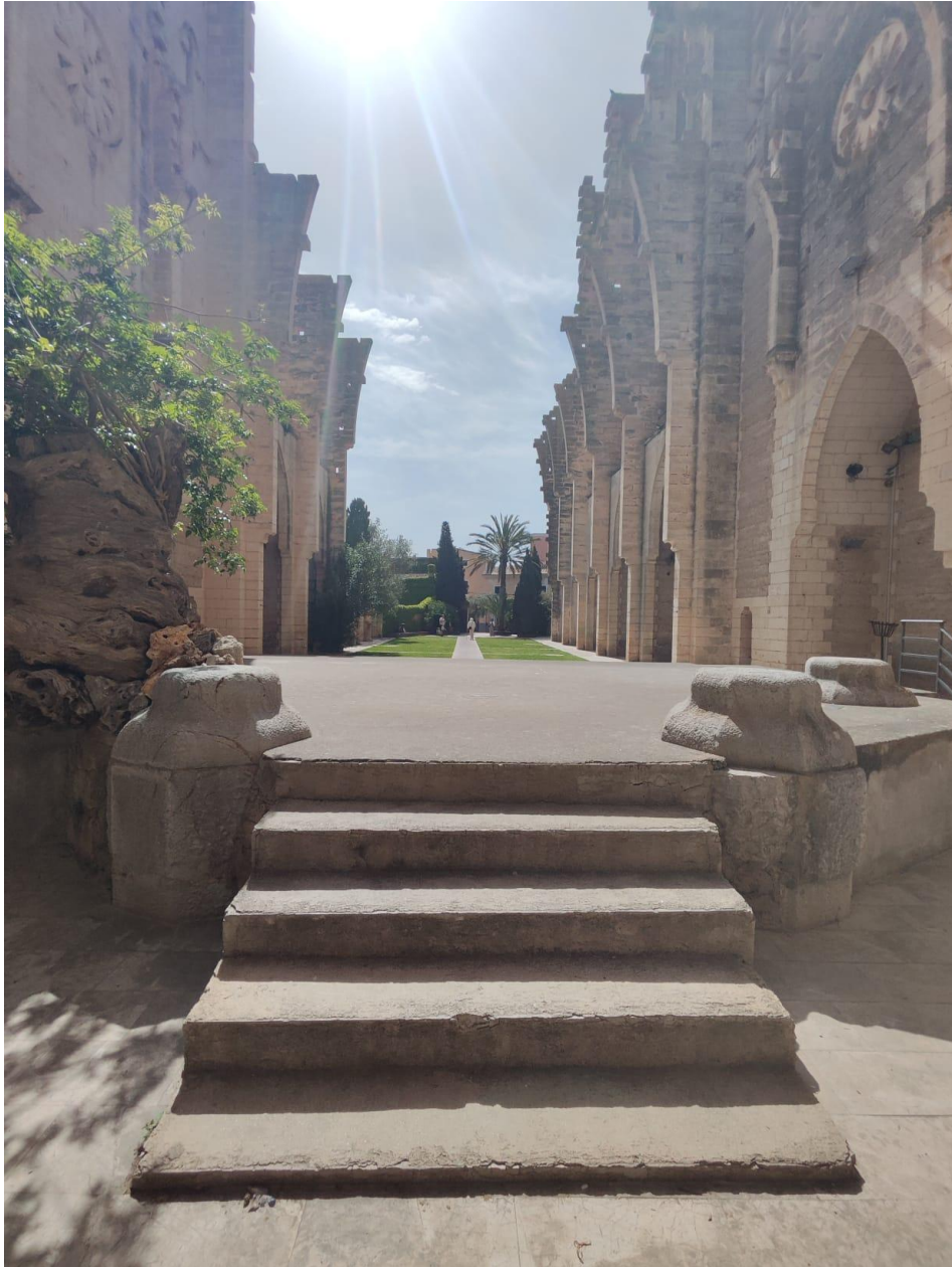
Imatge 14. Part posterior de l'escenari.