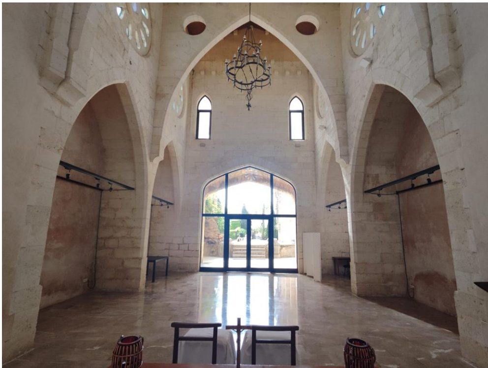
Imatge 9. Visió de la capella fonda des de l'altar.