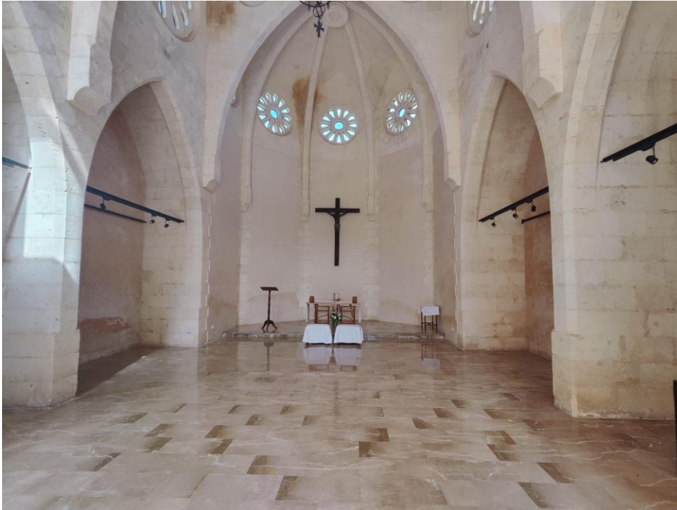
Imatge 8. Visió general de la capella fonda.