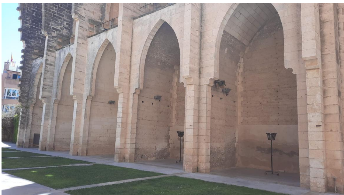
Imatge 1. Visió general de les capelles laterals