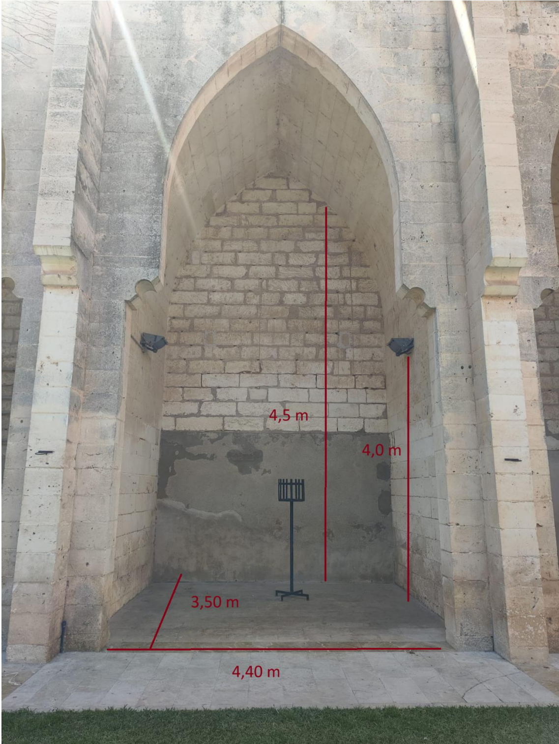
Imatge 2. Mesures de les capelles laterals.